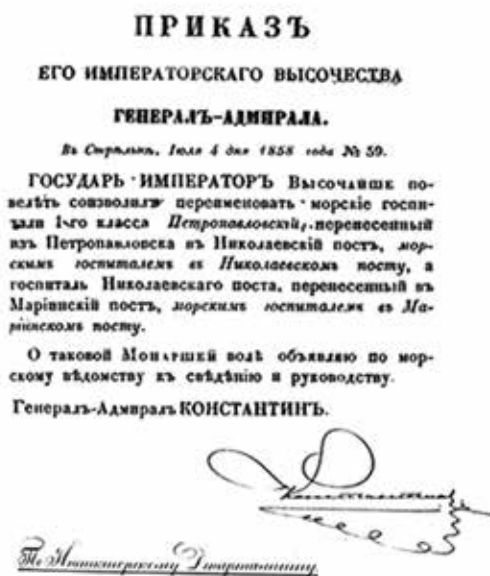
Рис. 3. Приказ о переименовании Петропавловского морского госпиталя после перевода в Николаевский пост, 1858 год [15]

4 июля 1858 г. был подписан Приказ № 59 Великого Князя Генерала-Адмирала Константина о переименовании бывшего Петропавловского госпиталя, перенесенного из Петропавловска в Николаевский пост, в морской госпиталь в Николаевском посту [15] (рис. 3).