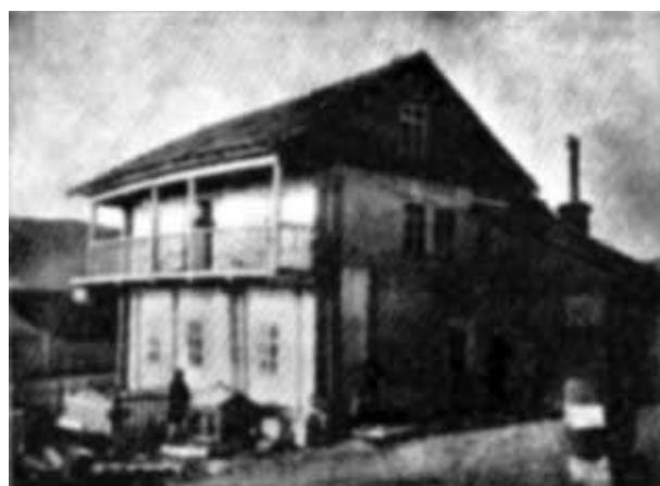
Рис. 2. Морской госпиталь в Охотске, 1791 год

Становление и развитие Охотского госпиталя связывается с появлением в нем главного доктора Федора Федоровича Реслейна, который проработал здесь с 1792 по 1797 год. По-видимому, это был один из первых докторов медицины, работавших на Дальнем Востоке. В это период начато строительство и расширение госпиталя, который в то время выглядел внушительно. Он состоял из нескольких добротных барачков, в которых размещалось 8 лечебных палат, аптека, два склада, баня и погреб. Ввиду отсутствия других медицинских учреждений в госпитале лечились не только военные чины, но и гражданское коренное население — эвенки и якуты [2, 5] (рис. 2).