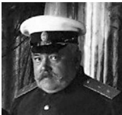
Август Августович Зорт

Флагманским врачом штаба Командования Морскими силами Балтийского моря с 01.05.1914 г. был назначен Доктор медицины Действительный Статский Советник (чин IV класса, соответствовал званию генерал-майора) Август Августович Зорт [3–5, 8, 10].