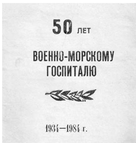
Фото 18. Сборник научных работ врачей 18-го ВМГ КТОФ. Владивосток, 1984