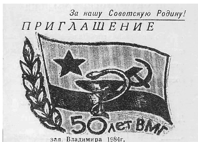
Фото 19. Пригласительный билет на торжественное собрание