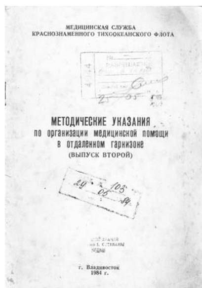
Фото 16. Сборник научных работ врачей 18-го ВМГ КТОФ. Владивосток, 1984

Участникам конкурса предлагалось выступить с докладом на заданную тему, приготовить все необходимое для внутривенного введения жидкостей, определить группу крови, развести и набрать в шприц заданный объем антибиотика и ответить на один из теоретических вопросов, связанных с оказанием неотложной медицинской помощи.