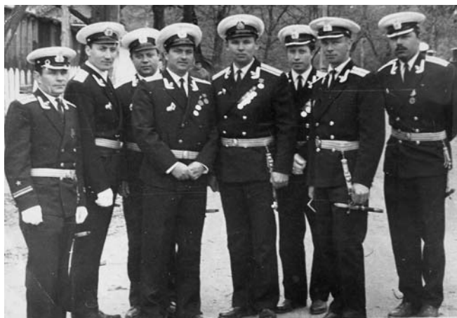
Фото 25. Офицеры 18-й ВМГ Приморской флотилии КТОФ

Были и печальные страницы в жизни Владимиро-Ольгинского гарнизона, так, например, вице-адмирал Герой Советского Союза, участник Гражданской и Великой Отечественной войн содержался в 30-е годы XX века в лагере особого назначения возле села Молдавановки Георгий Никитич Холостяков (1902–1983) [4, 14].