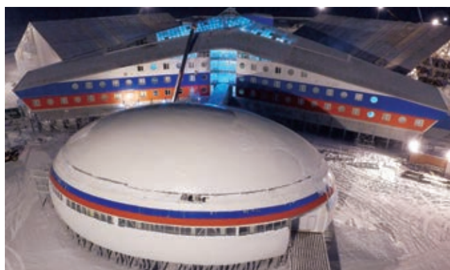
Рис. 1. Административно-жилой комплекс (АЖК) с медицинским блоком и зоной материально-технического обеспечения на о. Земля Александры архипелага Земля Франца-Иосифа

Медицинское обеспечение личного состава воинских частей и подразделений, несущих службу на о. Земля Александры архипелага Земля Франца-Иосифа, осуществляется силами и средствами медицинской службы отдельного радиолокационного отделения (РЛО). Медицинский пункт находится в медицинском блоке административно-жилого комплекса АЖК (рис. 1).