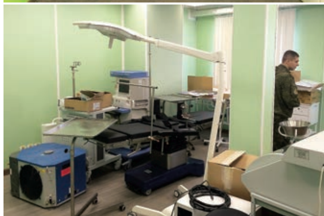
Рис. 5. Медицинское оборудование медицинского блока АЖК «Северный клевер» о. Котельный архипелага Новосибирские острова

Медицинское обеспечение личного состава РЛО, расположенного в п. Тикси Булунского района республики Саха (Якутия), осуществляется врачом-специалистом радиолокационного отделения совместно с медицинской службой авиационной комендатуры подразделения дальней авиации Восточного военного округа на базе объединенного медицинского пункта, расположенного в помещении авиационной комендатуры. Планируется строительство комплекса зданий для размещения