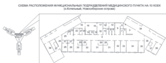
Рис. 4. Схема расположения помещений медицинского пункта АЖК «Северный клевер» на о. Котельный архипелага Новосибирские острова. 1 — ожидальная; 2 — гардероб; 3 — коридор; 4 — подсобное помещение; 5, 6 — санузлы; 7 — помещение для инвентаря; 8 — душевая; 9 — гардероб; 10, 11 — кладовые для больных; 12 — кладовая для вещей больных; 13 — санпропускник; 14 — тамбур; 15, 16 — санитарные зоны; 17, 18 — моечные; 19 — кладовая для стерильных материалов; 20 — тамбур; 22 — буфетная; 23 — санузел; 24 — кладовая для уборочного инвентаря; 25 — зона обработки посуды; 26 — изолятор; 27 — шлюз; 28 — палата изолятора; 29 — душевая; 30 — палата интенсивной терапии; 31 — палата на 4 койки; 32 — лаборатория; 33 — процедурная; 34 — операционная; 35 — кабинет врача; 36 — аптека; 37 — лестничная клетка; 38 — вентиляционная камера; 39 — коридор

Медицинское оборудование наименованием в 72 единицы, поставлено по госзаказу подрядной организацией ООО «ЗапСибГазпром», включая аппарат для ИВЛ «Dreger Primus», рентгеновский аппарат, аппарат УЗИ диагностики и др. (рис. 5).