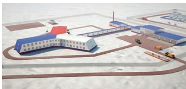
Рис. 3. Административно-жилой комплекс с медицинским блоком и зоной обеспечения на о. Средний архипелага Северная Земля

Медицинское обеспечение личного состава воинских частей и подразделений на о. Средний архипелага Северная Земля осуществляет медицинская служба отдельного радиолокационного отделения (РЛО), временно развернутая в блочно-секционном модуле. Медицинская служба представлена одним офицером — врачом-специалистом. На территории острова работают строители подрядной организации ООО «АС Инженеринг», обслуживаемые врачом-хирургом. После завершения строительства АЖК и введения в эксплуатацию медицинского оборудования медицинское обслуживание будет проводиться в специальном блоке с помещениями для операционной, реанимационной, лазаретом и др. (рис. 3).