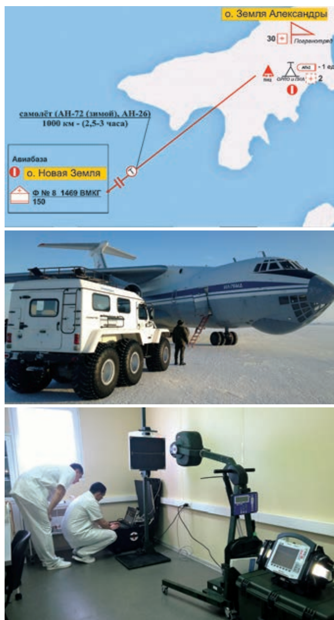
Рис. 2. Медицинский пункт и схема авиамедицинской эвакуации из о. Земля Александры

Эвакуация больных и пострадавших осуществляется авиатранспортом госпиталь филиал № 8 1469 ВМКГ о. Новая Земля (п. Белужья губа) с плечом эвакуации 1000 км и временем в пути 2,5–3 ч, в 1469 ВМКГ г. Североморск — 1340 км, время полета 3,5–4 ч. При необходимости в оказании специализированной, в том числе высокотехнологичной медицинской помощи эвакуация осуществляется в военно-медицинские организации центрального подчинения: ГВКГ им. Н. Н. Бурденко (Москва) (3400 км), Военно-медицинская академия им. С. М. Кирова (Санкт-Петербург) (2800 км) (рис. 2).