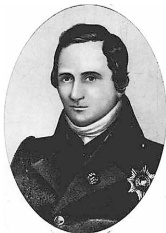
Рис. 1. Профессор И. Ф. Буш

Один из ярких представителей военно-медицинской науки, И. Ф. Буш (рис. 1), в свое время три года прослуживший лекарем на боевых кораблях Русского флота, первым из русских ученых-медиков обратил внимание в 1806 г. на «специфические особенности челюстно-лицевой хирургии» на важность организации зубоврачебной помощи плавсоставу, убывающему в дальние и кругосветные плавания [2–10].