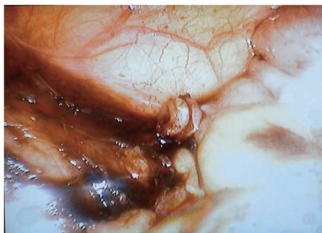
Рис. 3. Культи удаленного червеобразного отростка

вила 1 ч 7 мин. На 7-е сутки пациент в удовлетворительном состоянии был выписан в подразделение.