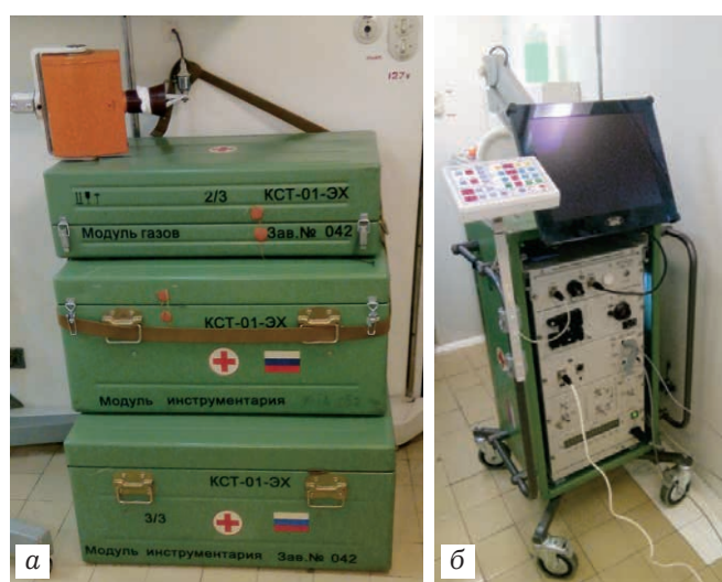
Рис. 1. Передвижной эндовидеохирургический комплекс КСТ-01-ЭХ производства фирмы «ЭФА медика»: а — сложенный в переносные модули; б — в развернутом виде

ного лечения. При контрольном осмотре через 2 ч отмечено усиление болевого синдрома, появление симптомов раздражения брюшины, нарастание лейкоцитоза до 16,2 \times 10^9/\text{л} по сравнению с исходным уровнем ( 12,3 \times 10^9/\text{л} ). В связи с диагностикой острого аппендицита и наличием на корабле передвижного отечественного эндовидеохирургического комплекса КСТ-01-ЭХ производства фирмы «ЭФА медика» (рис. 1), квалифицированной хирургической бригады было принято решение о выполнении диагностической лапароскопии. Проводилась предоперационная подготовка пациента. За это время были развернуты эндовидеохирургический комплекс и операционная.