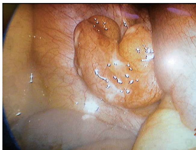
Рис. 2. Интраоперационная картина в брюшной полости. Червеобразный отросток с инъецированными сосудами, петехиальными кровоизлияниями, отеком, с наложениями фибрина, расположен типично

Был установлен дополнительный манипулятор из прокола в правой подвздошной области 10 мм. Аппендикулярная артерия и брыжейка отростка были пересечены с использованием моно- и биполярной коагуляции. Основание отростка было мобилизовано и перевязано тремя лигатурами, после чего отросток был отсечен и удален из брюшной полости (рис. 3). Операция закончилась дренированием брюшной полости. Макропрепарат представлен флегмонозно-измененным червеобразным отростком (рис. 4). Продолжительность операции соста-