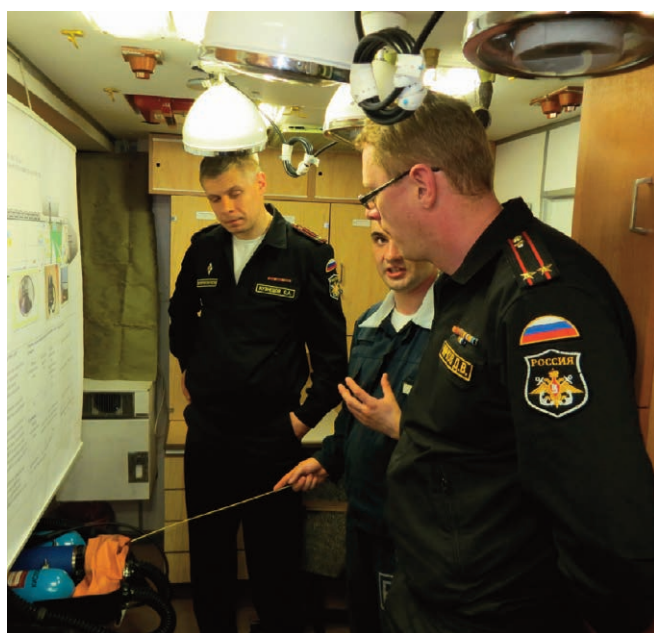
Демонстрация возможности проведения оксигенобаротерапии в медицинском блоке РПКСН «Юрий Долгорукий».