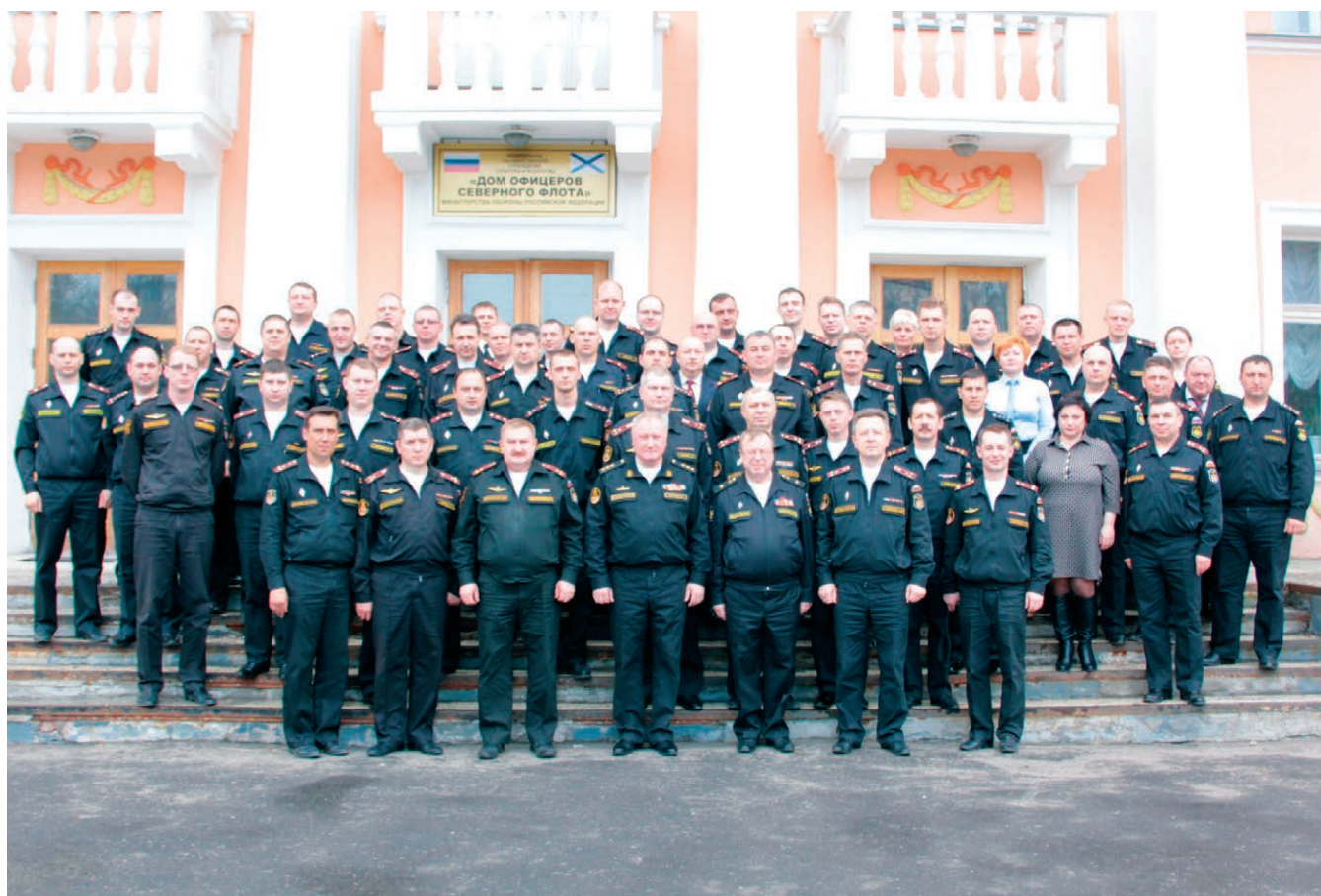
Участники сбора (Дом офицеров Северного флота, г. Североморск).