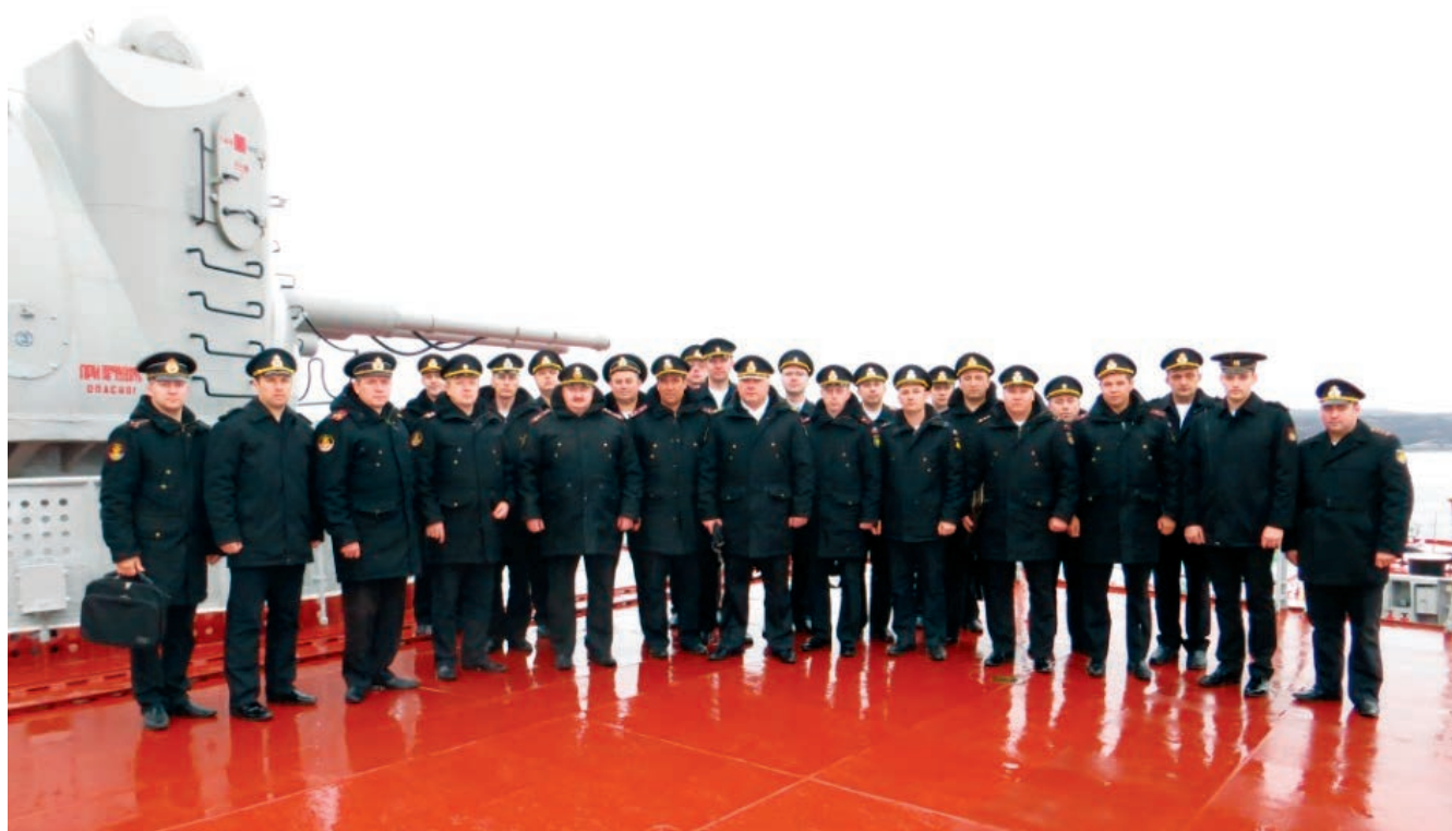
Посещение ТАРКР «Петр Великий».