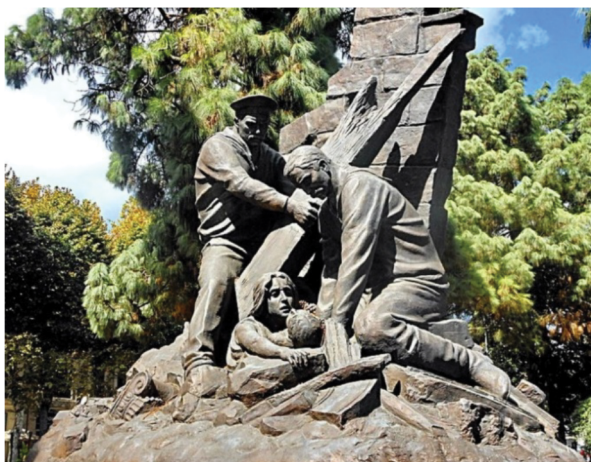
Рис. 11. Проект памятника был представлен в 1911 г. итальянским скульптором Пьетро Кюфферле

Fig. 11. The design of the monument was presented in 1911 by the Italian sculptor Pietro Kufferle