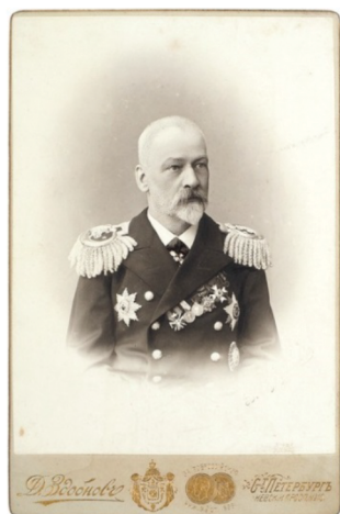
Рис. 2. Кабинетная фотография с автографом генерал-майора действительного статского советника свиты Его Величества доктора Владимира фон Рамбаха. Fig. 2. An autographed cabinet photo of Major General, acting State Councilor of His Majesty's entourage, Dr. Vladimir von Rambach.

Доктор медицины. В. Н. Попов редактировал «Медицинскую Библиотеку» (1881), с 1882 г. издавал «Международную Клинику», в 1884–1885 гг. выпускал «Медицинские Новости». На 1890 г. – статский советник. Старший судовой врач 2-го флотского экипажа и приват-доцент ИМХА, СПб. На 1891 г. – «в плавании». На 1894 г. – флагманский доктор Балтийского флота [2].