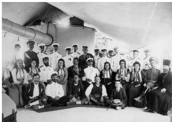
Рис. 6. Прием черногорской делегации на борту крейсера «Адмирал Макаров». У офицеров на левой стороне мундира – Орден Князя Даниила I Fig. 6. Reception of the Montenegrin delegation on board the cruiser Admiral Makarov. The officers have the Order of Prince Daniel I on the left side of their uniforms

Fig. 5. Montenegrin gold medal “For jealousy”. The medal was issued in the “gold” and “silver” versions