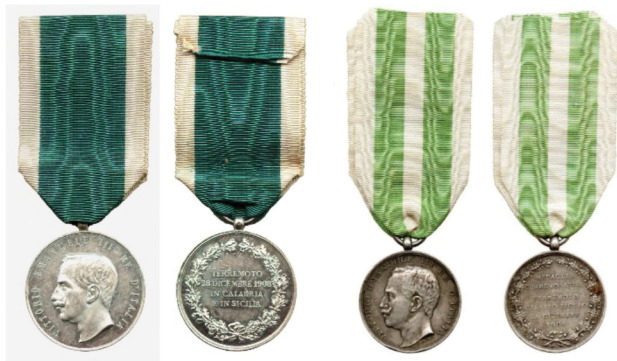
Рис. 10. Медали «В память землетрясения в Калабрии и на Сицилии» (итал. La medaglia commemorativa per il terremoto calabro-siculo )