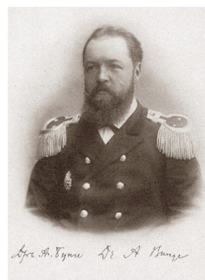
Рис. 9. Действительный статский советник А. А. Бунге