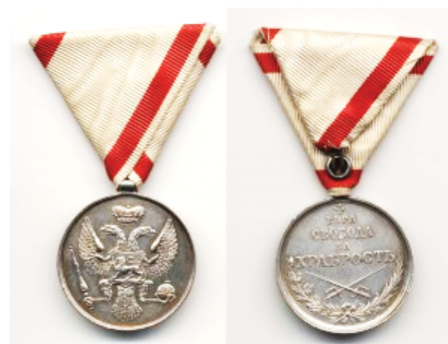
Рис. 7. Черногорская медаль «За храбрость» 2-й ст. тип 2 (1878–1912)

Организацией медицинской помощи раненым на берегу и на кораблях руководил флагманский врач эскадры действительный статский советник Александр Александрович Бунге (28.10.1851, Дерпт – 19.01.1930, Ревель) (рис. 9). Звание лекаря получил в 1880 г. Выпускник Дерптского университета. Доктор медицины (1880). Полярный исследователь. Участник Русско-японской войны 1904–1905 гг. Флаг-