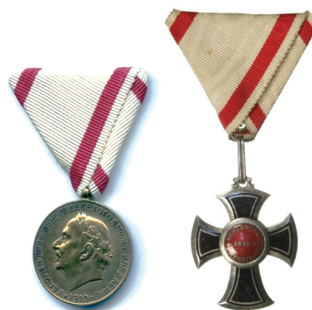
Рис. 4. Награды Королевства Черногории: В память 50-летия Царствования Князя Николая I и «Орден Князя Даниила I»