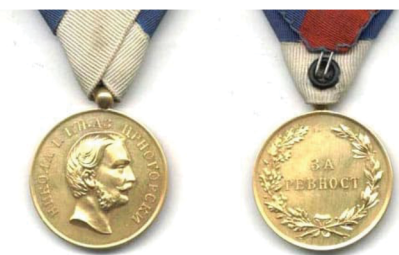
Рис. 5. Черногорская золотая медаль «За ревность». Медаль выпущена в варианте «золотая» и «серебряная»

Fig. 5. Montenegrin gold medal “For jealousy”. The medal was issued in the “gold” and “silver” versions