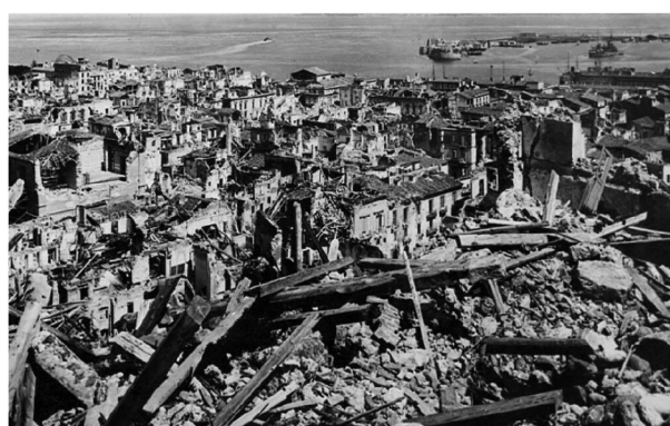
Рис. 8. Мессина после землетрясения Fig. 8. Messina after the earthquake