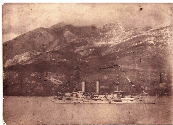
Рис. 3. Линейный корабль «Цесаревич». Антивари. 1910