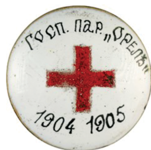
Рис. 6. Знак Красного креста госпитального судна «Орёл» на имя Л. К. Геймана Fig. 6. The Red Cross sign of the hospital ship “Eagle” in the name of L. K. Geyman

В 1917 г. назначен помощником санитарного инспектора Морской крепости императора Петра Великого. Статский советник.