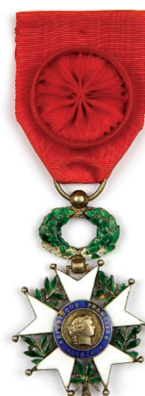
Рис 8. Знак Офицера Ордена Почётного легиона Fig. 8. Badge of an Officer of the Legion of Honor