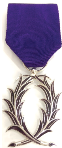
Рис. 10. Знак Ордена Академических пальм «Officier d'Académie» («шевалье»)