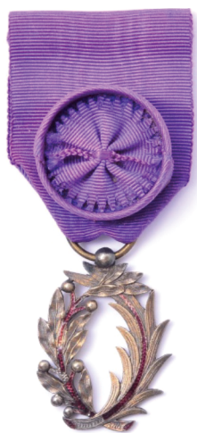
Рис. 11. Знак офицера народного просвещения Fig. 11. Officier de l'Instruction Publique

в Императорский клинический институт Великой Княгини Елены Павловны для научного усовершенствования [4].