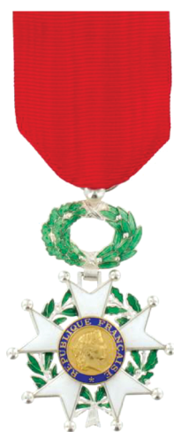
Рис. 1. Знак Кавалера ( Chevalier ) Ордена Почётного легиона

Первыми государственными наградами Франции стали орден Святого Михаила (Крест Ordre de Saint-Michel , XV в.), орден Святого Духа (Крест Ordre du Saint-Esprit , XVI в.), военный орден Святого Людовика (Крест Ordre Royal et Militaire de Saint-Louis , XVII в.). Все