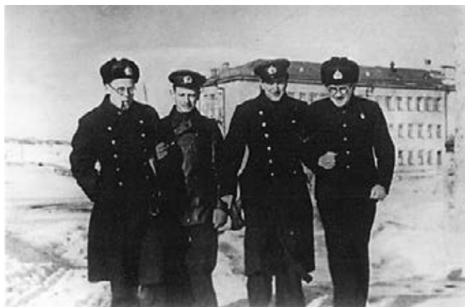
Рис. 4. Флагманский врач соединения подводных лодок в годы Великой Отечественной войны полковник м/с З. С. Гусинский (крайний справа).

до 23% личного состава от воздействия оружия противника и в результате внутрилодочных аварий. Разрушение прочного корпуса подводной лодки приводило к гибели 100% экипажа.