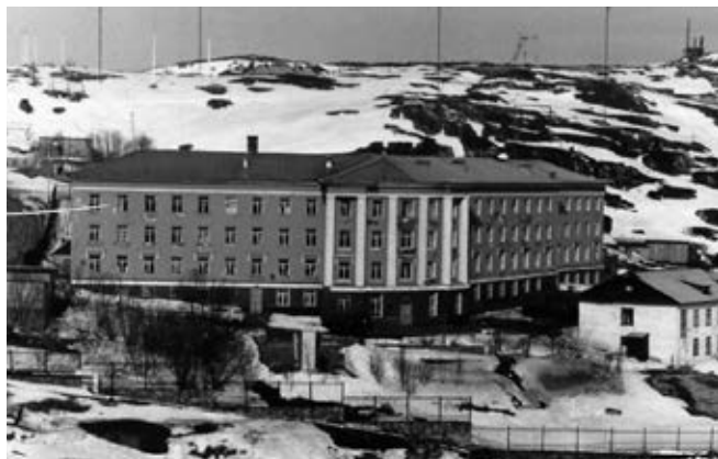
Рис. 6. Главный госпиталь Северного флота г. Полярное.