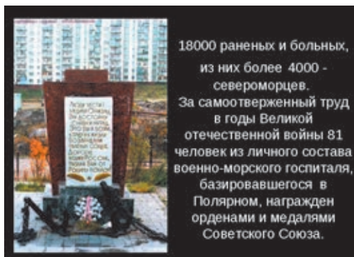
Рис. 8. Памятник военным медикам на территории филиала № 5 ФГКУ «1469 ВМКГ» Минобороны России в г. Полярном.

Таким образом, за годы Великой Отечественной войны медицинской службой СФ был накоплен огромный практический опыт медицинского обеспечения подводных лодок СФ как в ходе боевых действий на море, так и в период нахождения в пункте базирования. Изучение этого опыта послужило базой для дальнейшего развития системы медицинского обеспечения сил флота в послевоенный период, успешного внедрения его при зарождении атомного подводного флота. Некоторые разработки и взгляды на систему медицинского обеспечения подводных лодок в условиях Заполярья не потеряли актуальности и в наши дни.