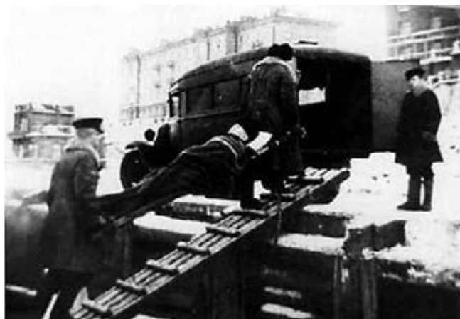
Рис. 5. Эвакуация раненого с подводной лодки после похода. г. Полярное, 1943 г.

В 1943 году штат госпиталя увеличился до 300 коек с фактическим развёртыванием до 450–460 коек. В связи с частыми бомбардировками г. Полярного было открыто скальное