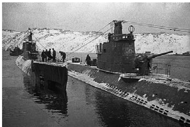
Рис. 1. Подводные лодки типа Д в г. Полярном (1942 г.).

соединении подводных лодок Северного флота зарождалась традиция шефства над кораблями со стороны организаций и трудовых коллективов страны. В 1943 г. в составе бригады появились подводные лодки М-104 «Ярославский комсомолец», М-107 «Новосибирский комсомолец», М-105 «Челябинский комсомолец» и М-106 «Ленинский комсомол», построенные на средства, собранные трудящимися Ярославской, Челябинской и Новосибирской областей. Вступила в строй подводная лодка М-200 «Месть», построенная на средства, собранные вдовами погибших моряков и личным составом бригады подводных лодок [1, 4, 6, 7]. Активно действовали первенцы советского подводного кораблестроения подводные лодки типа Д (рис. 1).