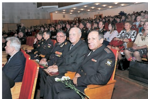
Участники конференции.