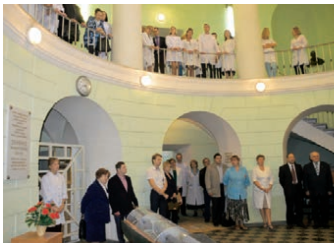
Торжественный митинг в ротонде кафедры военно-морской терапии ВМедА 25.09.2015 г.