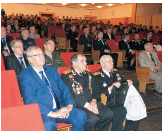
В конференц-зале клуба ВМедА 24.09.2015 г.