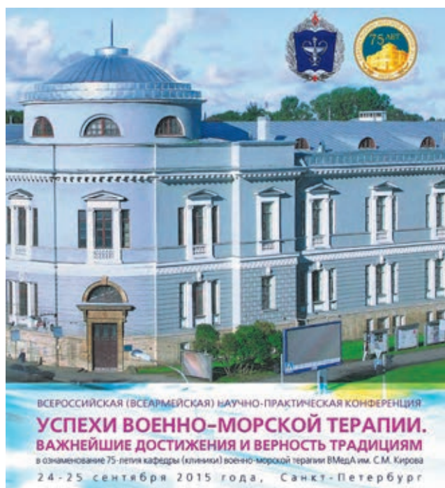
Обложка брошюры с программой конференции.

Результаты конференции продемонстрировали актуальность военно-морской терапии в качестве одной из ведущих дисциплин военно-морской медицинской науки, а также важную роль кафедры военно-морской терапии ВМедА для ВМФ на современном этапе его развития.