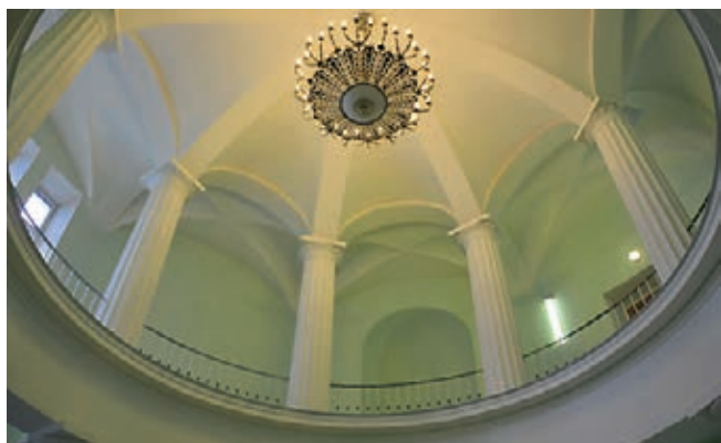
Купол ротонды в здании кафедры военно-морской терапии ВМедА.